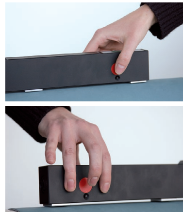
Roter Punkt = Andruckkraft-Kompensationspunkt Bedienposition = Position für Kompensation der Andruckkraft, d.h. Andruckkraft hat hier den geringsten Einfluss auf den Messwert