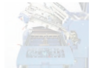
Offener Kreuz- und Dreibruchbereich