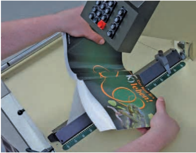
Typischer Qualitäts-Check: Kontrolle einer Broschur mithilfe des „Variotesters“.